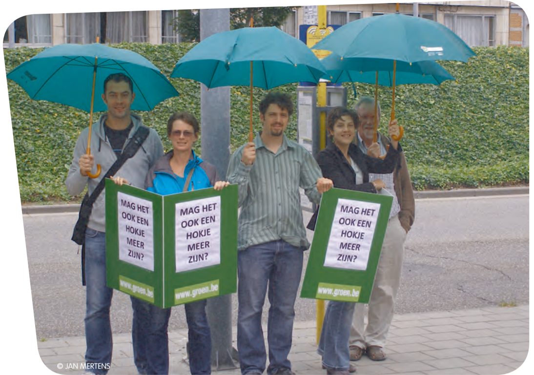
Groen! voert actie voor meer bushokjes op de Vesten.

Na de discussie in de gemeenteraad en daarna ook in het AGSL, dat de beheerder is van het stadskantoor, is afgesproken dat nu zal onderzocht worden of men voor het stadskantoor geheel of gedeeltelijk zou kunnen overstappen op dagschoonmaak. We zijn heel blij met dit resultaat.