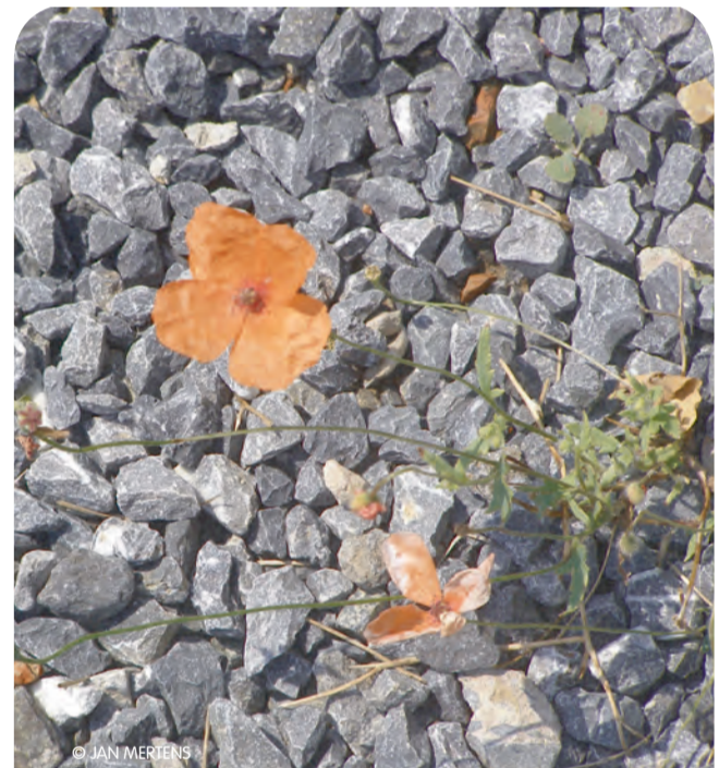
Groen! staat achter de forse ambitie van het stadsbestuur.