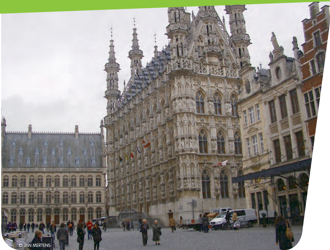
Meer groene raadsleden in het stadhuis in 2012, dat is de inzet.

6 de staats- hervorming: de bijdrage van Groen!