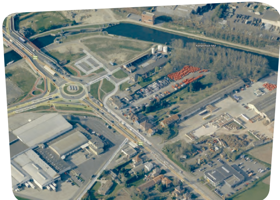
De economische knoop van Kampenhout Sas: komt er naast een extra bedrijventerrein ook straks nog een oven bij?

Komen er binnenkort grote logistieke bedrijven bij aan Kampenhout-Sas? Zo zijn er plannen voor een grote overslagcontainerhal van 18 meter hoog, met 20.000 liters dieselopslag. Officieel zijn de terreinen bedoeld voor "regionale economische ontwikkeling". Maar aan welke lokale noden wordt hiermee beantwoordt? En komt er nu al of niet een extra afvalverbrandingsoven? Veel vragen, weinig antwoorden.