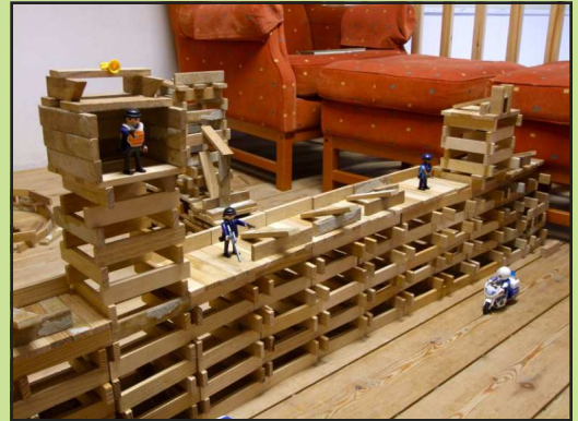
De Israëlische Muur door Leuvense kinderen van 8 en 9 jaar.

Het tribunal verloopt in meerdere thematische sessies. Vorig jaar kwam in Barcelona de verantwoordelijkheid van de EU en de EU-lidstaten aan bod. In Londen werd dieper ingegaan op de rol die bedrijven spelen in de mensenrechtenschendingen. Eén van de bedrijven die aan bod kwam is Dexia NV, dat in 2001 de controle verkreeg over de Israëlische bank Otzar Hashilton Hamekomi, nu Dexia Israël. Deze bank financiert steden, gemeenten en andere openbare besturen, niet alleen in Israël, maar ook in bezet gebied. Met andere woorden: Dexia Israël financieert de bezetting, en is dus medeplichtig aan zware schendingen van het internationaal recht.